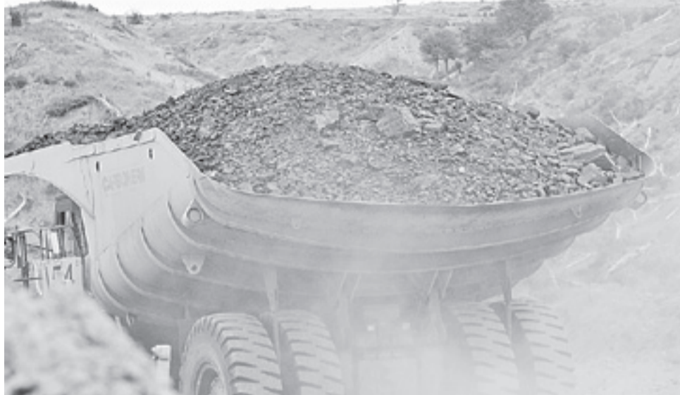
La agrupación A.C.U.E. expuso a Bachelet su rechazo al proyecto minero en Natales es concordante con las líneas de desarrollo planteadas por la Jefa de Estado como lo son la justicia social, la equidad para los chilenos y la calidad de vida.

En tercer lugar, exponen que “Una nueva mina de carbón se contradice con el desarrollo limpio y sustentable de nuestro país. Usted