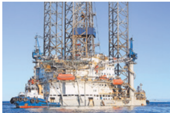
Remolcador Beagle en operaciones en Punta Arenas.

Durante estos 50 años, Ultratug ha logrado una posición de liderazgo en Sudamérica, entregando seguridad a las naves y puertos en las maniobras y operaciones marítimo-portuarias.