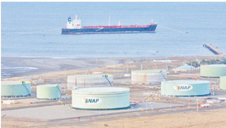
Enap lidera la cartera de inversiones y proyectos ingresados para evaluación ambiental.

El segundo ámbito productivo dominante en los ingresos al Sea, es el de Pesca y Acuicultura, el que hasta el 1 de diciembre figura con un proyecto aprobado, lo que se traduce en 88,9% menos de iniciativas validadas a la misma altura del año que en 2015, que tuvo 9 propuestas con visto bueno. En términos de inversión, el proyecto calificado positivamente este año asciende a los US$2.000.000, monto 92,5% menor