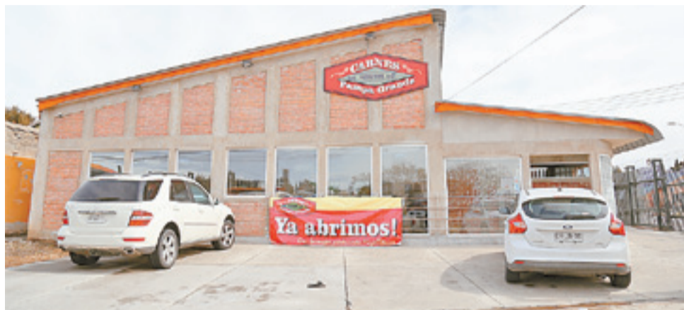
En Avenida España con calle Piloto Pardo se encuentra ubicado el local "Carnes Pampa Grande". El establecimiento cuenta con un amplio estacionamiento vehicular.

El horario de atención al público en Carnes Pampa Grande es de lunes a viernes, entre las 9,30 a 13 horas y desde las 15,30 a 19,30 horas, mientras que el día sábado la atención es de 9,30 a 13 horas y de 15 a 18 horas.