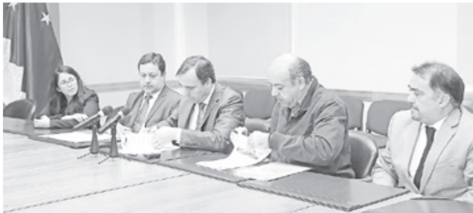
La firma del contrato de estudio de terrenos se materializó ayer en la intendencia regional.