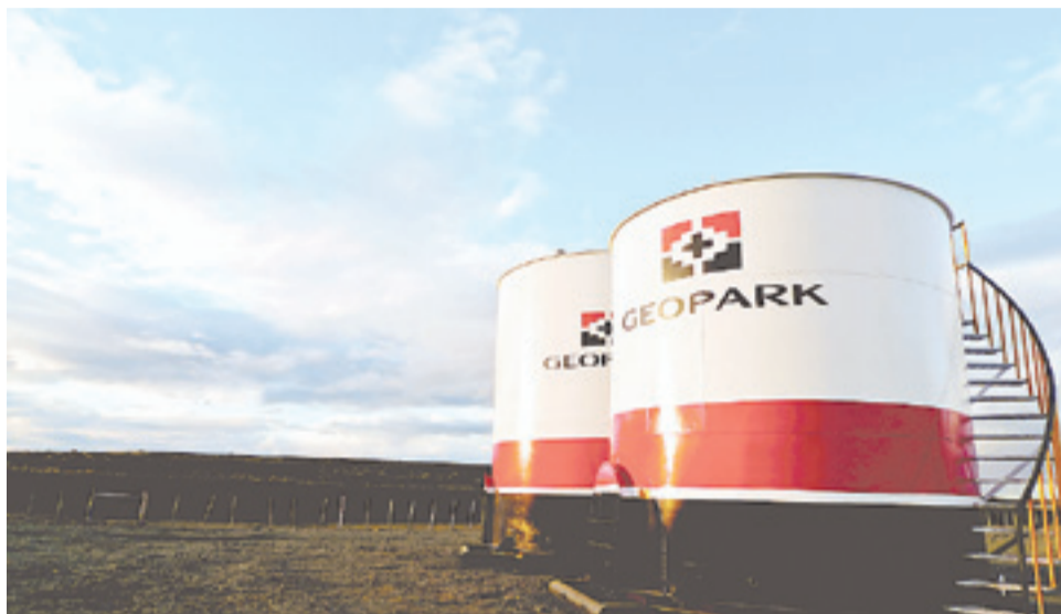
Durante el tercer trimestre de este año, la producción promedio de petróleo y gas por parte de GeoPark, llegó a nivel nacional a los 3.756 barriles, lo que representa un aumento del 17% en comparación con los 3.207 boepd logrados en igual período de 2015

A saber, durante el tercer trimestre de este año, la producción promedio de petróleo y