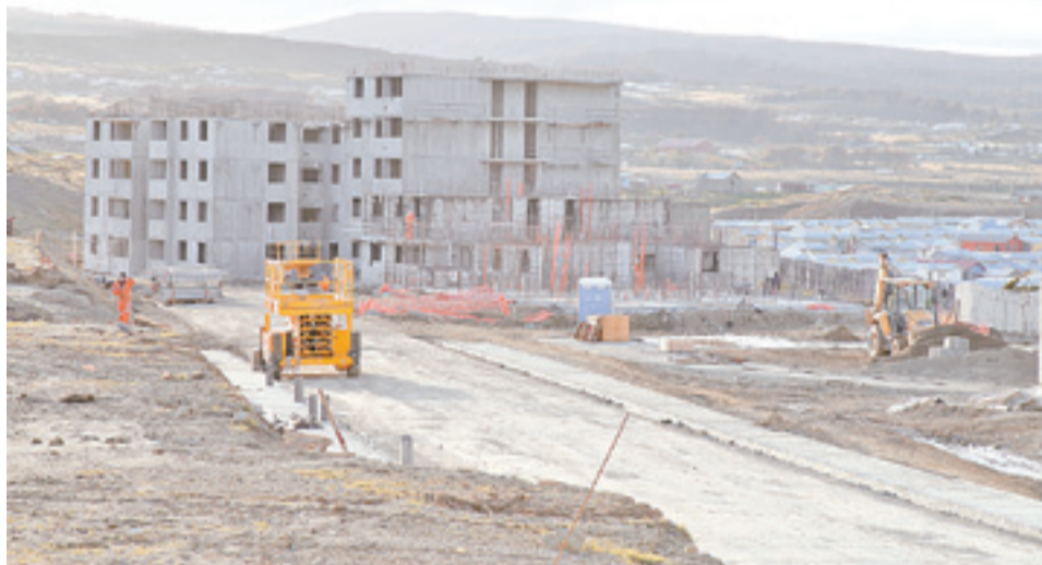
En el mes de enero, la variación del Inacor llegó en Magallanes a -5,3 %, cifra que según la CChC, se explica en parte por la caída de la ocupación regional en el sector construcción de un 0,8%.

país. “Y eso, a pesar de que tiene una base de comparación anterior que es tremendamente débil porque, en los últimos dos años, había venido con índice