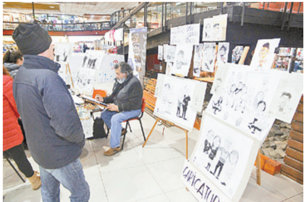
En la muestra las personas podrán encontrar diversas elaboraciones manuales, realizadas por artesanos magallánicos.