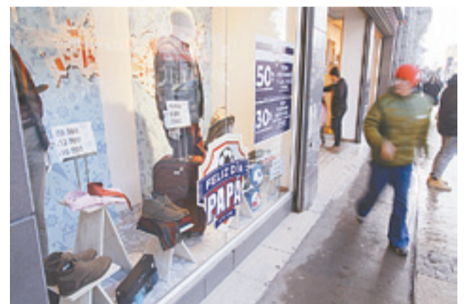
La onda futbolera es siempre una de las tendencias más populares en los locales comerciales.