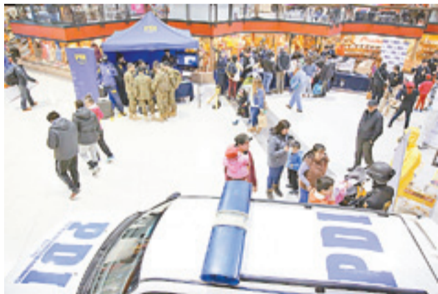
El año pasado la PDI también estuvo en la Zona Franca para mostrar al público aspectos de su labor policial.