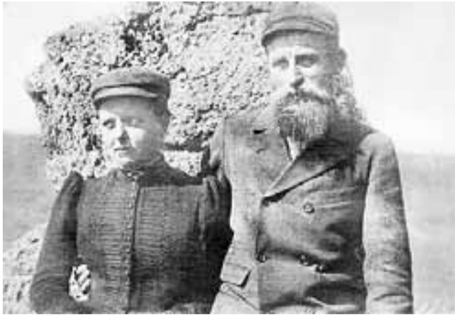
Dorotea y su esposo.