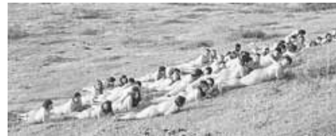
Aquella sesión fotográfica incluyó una serie de tomas sobre una loma del predio particular elegido, en el kilómetro 7,5 Sur.

po, canturrea estilos tan disímiles como Kraftwerk o Los Jaivas.