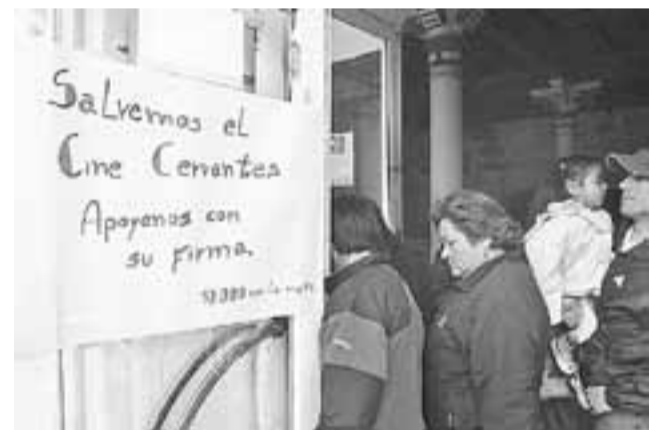
Los Amigos del Cine Cervantes recolectaron 12 mil firmas con el objeto de transformar la sala de cine en un monumento nacional.