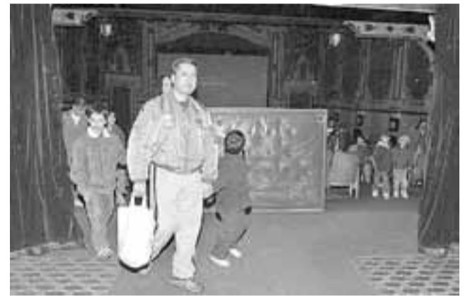
El público asistente a una de las últimas funciones.