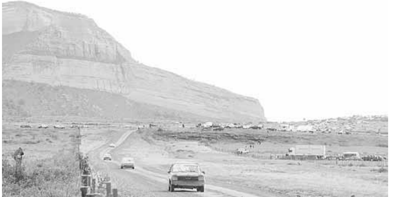
El Cerro Dorotea, de Puerto Natales, fue bautizado así en homenaje a la hija de Eberhard.

“Julio 4. La noche era intensamente fría. Desde anteayer, es decir, desde que encontramos a los primeros indios, pusimos guardia por toda la noche, tanto para avisar cualquier peligro, como también para mantener el fuego. A las ocho el termómetro marca 8