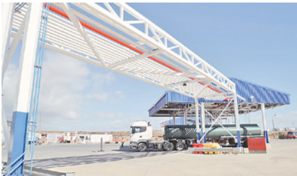
El procesamiento y embarque tiene lugar en la planta Cabo Negro de Enap Magallanes, aprovechando las ventajas logísticas de dicha instalación.

Sumado al movimiento comercial descrito, la Línea R&C en Magallanes sumó otro hito. A saber, consiste