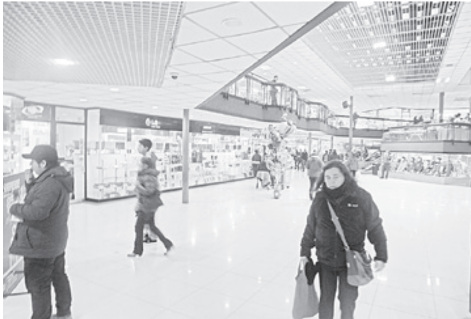
Desde fines de la década de los setenta la Zona Franca de Punta Arenas es uno de los centros comerciales más importantes de la región.

Junto con ello, recaló que la empresa se ha esforzado