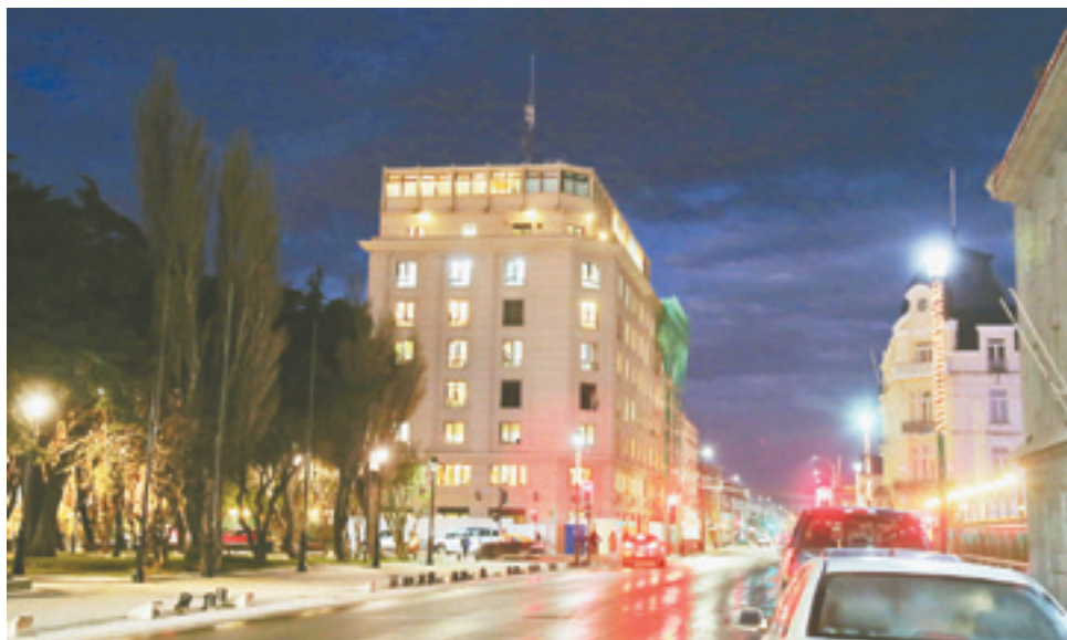
Un plazo de sesenta días tiene Enap Magallanes para disipar las dudas planteadas por la Contraloría General de la República.

Así las cosas, la muestra auditada comprende las indemnizaciones pagadas a 33 ejecutivos de Enap