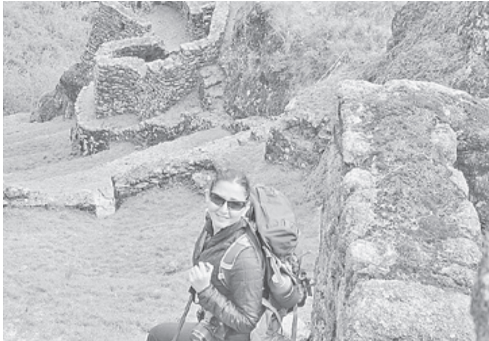
La nueva directora regional del Servicio Nacional de Turismo, disfrutando de un recorrido en el Camino del Inca, en mayo de 2017, siendo este y muchos otros lugares inspiración suficiente para asumir con bríos el liderazgo de esta entidad.

- “Tenemos un potencial tremendo y de ahí la importancia de ampliar nuestra alternativa de lugares para visitar, incorporando fuertemente Tierra del Fuego,