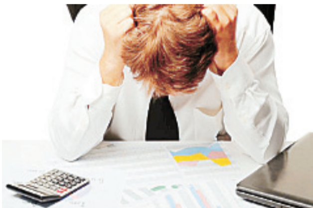
Chilenos más morosos que nunca: deudores alcanzan cifra récord que supera los 4 millones de personas.

En mejor posición que nuestra región, se identifica a Coquimbo y Valparaíso (ambas con 39%); Metropolitana de Santiago (38%); Del Maule, Los Ríos y Los Lagos (todas con 36%); Tarapacá y