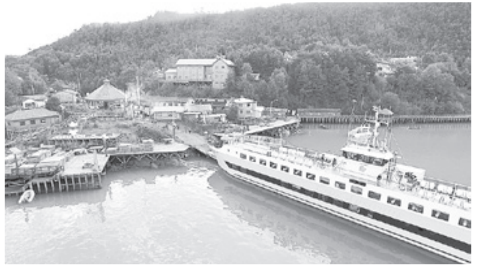
El 14 de mayo de 2016 Tabsa comenzó a dar conectividad directa a través de su ferry Crux Australis, a las localidades de Puerto Yungay, Caleta Tortel, Puerto Edén y Puerto Natales.

Consignó en esta materia, que desde el inicio de operaciones y hasta el 24 de abril de 2017, han sido transportados un total de 4.846 pasajeros nacionales y 674 extranjeros; 892 vehículos; 175 toneladas de carga general y víveres; 585 toneladas de turba; 21.615 postes de ciprés y 3 mil sacos de mariscos frescos. "Con esta alternativa de traslado, le hemos cambiado la vida a todos los habitantes de esos sectores, especialmente a los de Cochrane y Villa O'Higgins, desde donde vienen directamente a comercializar sus productos. Esto