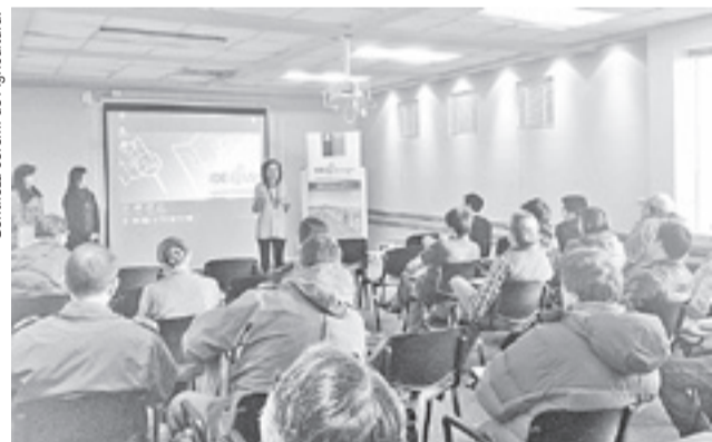
La iniciativa fue presentada a través de una serie de capacitaciones, en el marco del programa de Infraestructura de Datos Espaciales.

El valor mensual a transferir es entregado por la Comisión Nacional de Energía y por cierto, beneficia directamente a unas 159.102 personas, según expresa el sitio.