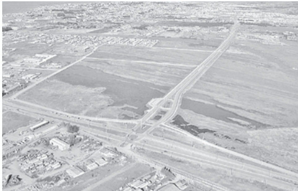
Para abril de 2017 se espera contar con las soluciones adecuadas para las obras de ingeniería destinadas a retener y aportar -de ser necesario-, fuentes de agua con la calidad físico-químicas apropiadas para ser conducidas hacia el humedal.

Foretich puntualizó que para abril de 2017 se espera contar con las