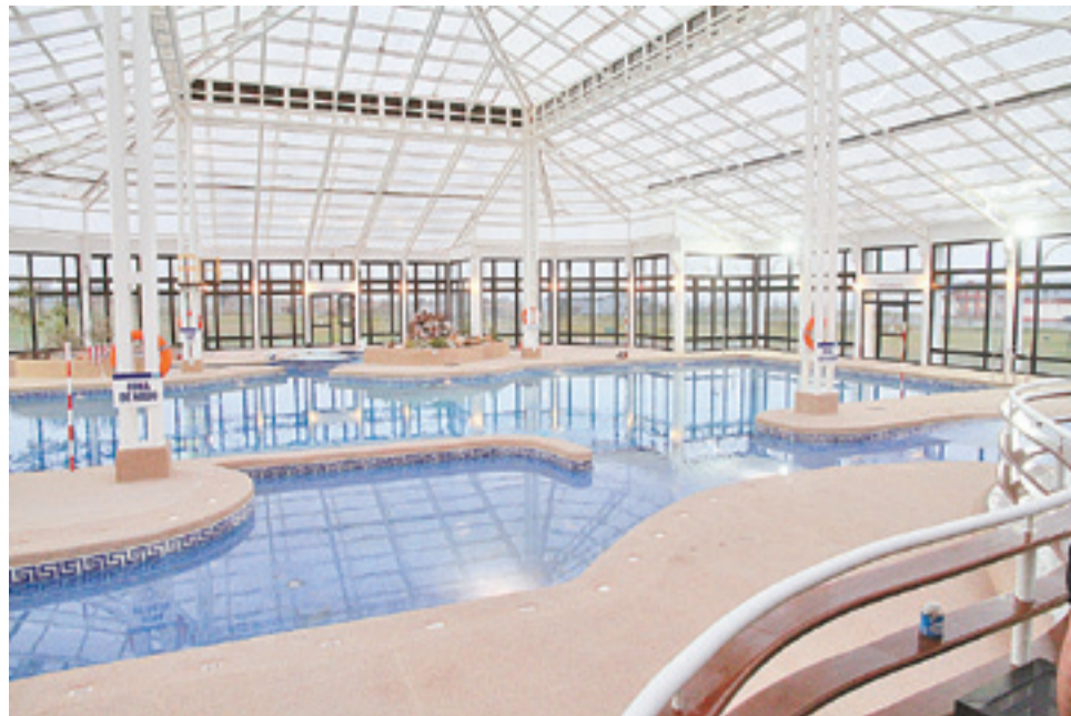
La piscina temperada del Complejo Leñadura de Caja Andes es una de las principales atracciones elegida por los afiliados, para disfrutar del tiempo libre.

"En Caja Los Andes hasta el 65% de los excedentes anuales se destinan al financiamiento de beneficios sociales. Por ejemplo, este año invertiremos en ellos -contra recursos del ejercicio 2015- alrededor de 40 mil millones de pesos, lo que puede duplicarse y aún más, si consideramos el poder