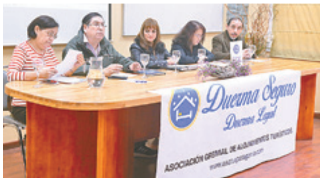
Durante el lanzamiento de la campaña, la directiva de la Asociación Gremial de Alojamientos Turísticos de Punta Arenas dio a conocer sus principales aprensiones en materia de establecimientos informales.

"El programa es grande, porque nos sobrepasó. Somos alrededor de 135 establecimientos -formales- y la primera nómina que hemos entre-