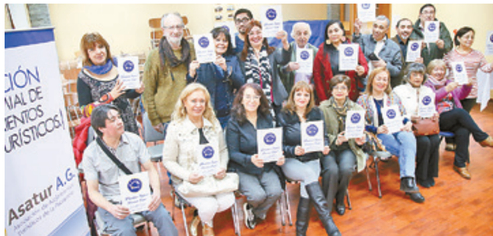
La campaña 'Duerma Seguro, duerma legal', busca concientizar a la ciudadanía y a quienes dan alojamiento 'fuera de la ley', de que es necesario brindar a los turistas, lugares que den garantías en todo orden de cosas.

muchos los problemas de seguridad que enfrenta un pasajero que opta por un establecimiento que no ha sido fiscalizado y no cumple las normas. "Tenemos que ponernos a la altura de un destino que tiene la Octava Maravilla del Mundo, no podemos estar llamando a que vengan a Magallanes, cuando tenemos un mercado negro paralelo. Y eso no