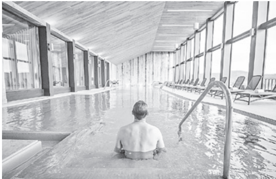
La piscina, dotada de altos estándares de automatización y control, cuenta con vista panorámica al macizo de Torres del Paine y es surtida con agua procedente de glaciares a través del río Serrano.