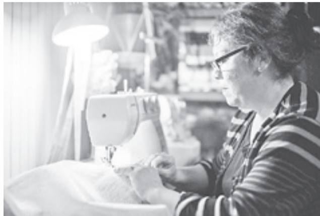
Las jefas de hogar son pieza central en la elaboración de las innovaciones que hoy tienen de parte de Puro Viento, un sello regional, anclado en un espíritu sustentable y social.

Se trata del trabajo codo a codo que realizan en la actualidad con internos de la cárcel y jefas de hogar, los que son a la fecha los principales trabajadores de este proyecto que llegó para dar una segunda oportunidad no sólo para sus materiales y el medio ambiente, sino que también para las personas. "El acercamiento para trabajar con personas privadas de libertad comenzó en el año 2013, a través de un contacto