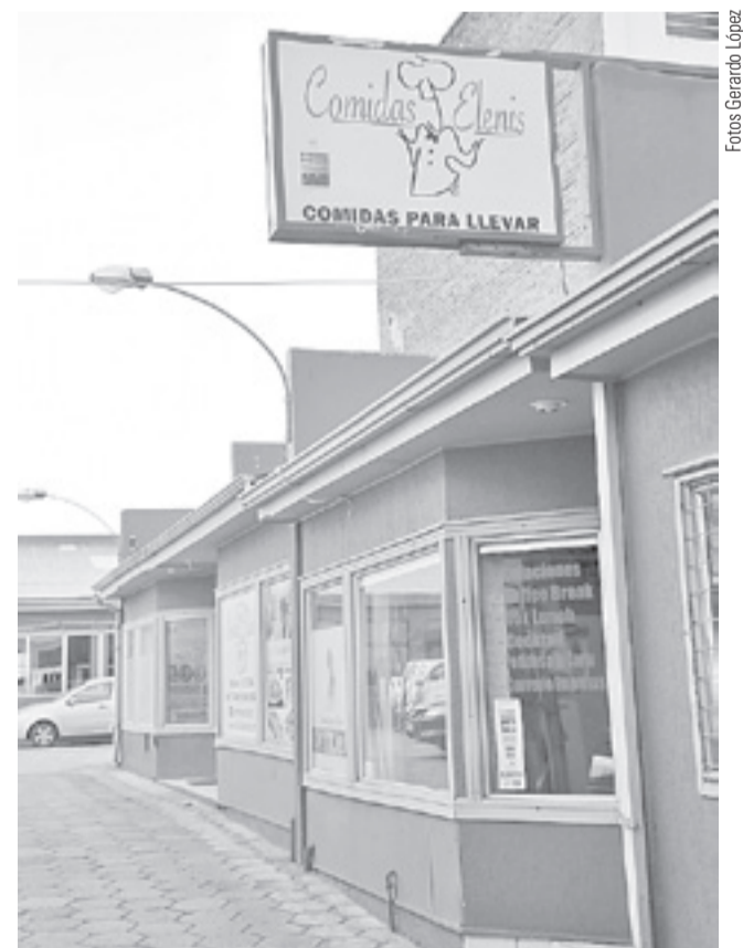
En calle José Nogueira N°1130 Local D, es posible encontrar las Souvlakias del local de comidas Elenis.