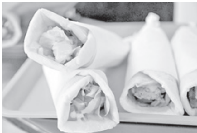
La Souvlakia producto que incorpora exquisiteces para todos los gustos: palta, tomate, lechuga, brócoli, coliflor o pepino y papas fritas naturales, entre otras, dan el toque especial a esta preparación.

La opción en sí, tanto por su preparación, como por la forma de ser presentada y su nombre, no dejan de llamar